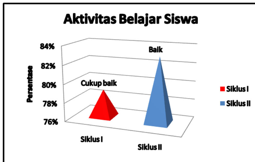
Gambar 1. Peningkatan aktivitas belajar siswa pada siklus I dan II.