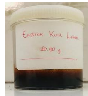
Gambar 1. Ekstrak kental kulit lemon

pada gambar 1. berupa banyaknya ekstrak kental kulit buah jeruk lemon yang berwarna coklat kekuningan dengan bau khas aromatik.