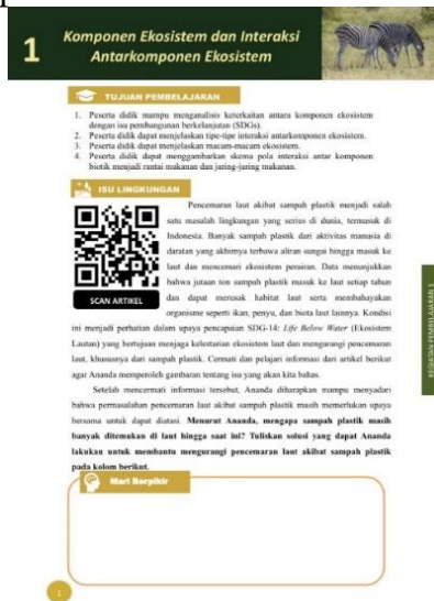
Gambar 2. Tampilan Isu Lingkungan

Contoh perancangan isu lingkungan dapat dilihat pada Gambar 2.