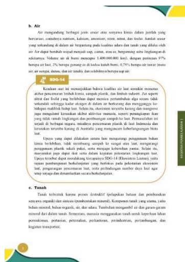
Gambar 3. Tampilan Muatan SDGs

Contoh perancangan muatan SDGs dapat dilihat pada Gambar 3.