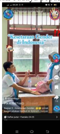
Gambar 4. Contoh Konten Edukasi Siswa Di Sekolah

Pemanfaatan elemen visual, musik populer dan teks singkat mengukuhkan daya tarik konten emosional serta membangun amanat pesan disampaikan mudah untuk diingat penonton konten. Temuan ini di sisi lain menunjukkan ambivalensi, di mana konten ini bisa saja mereproduksi stereotip gender apabila tidak disertai pesan kritis yang jelas (Lingtersa, Siregar, and Alindra 2025). Pola komunikasi pada TikTok ditemukan adanya dua sisi manfaat: sisi pertama menjadi sarana edukasi yang bermakna, sisi ke-dua bermanfaat dalam menguatkan ranah norma gender melalui algoritma dan budaya populer.