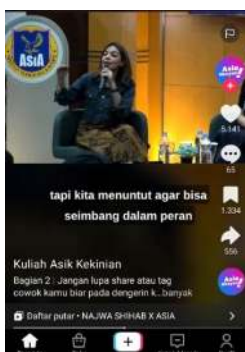
Gambar 2. Konten TikTok2 Representasi Kesetaraan Gender Menurut Najwa Shihab

KT2 mengkritisi persepsi keliru masyarakat yang menyamakan kesetaraan gender dengan tuntutan penyamaan peran secara absolut. N menegaskan bahwa kesetaraan berarti keseimbangan, bukan keseragaman. Ia membedakan antara fungsi biologis perempuan (menstruasi, kehamilan, melahirkan, dan menyusui) sebagai kodrat, dengan peran domestik yang bersifat sosial dan dapat dilakukan oleh siapa pun. Pemahaman ini didukung oleh (Kusmana et al 2020) yang menekankan perbedaan antara kodrat biologis dan konstruksi peran gender. N juga menolak anggapan bahwa pendidikan tinggi atau karier publik bertentangan dengan identitas perempuan. Ia menekankan bahwa perempuan memiliki hak yang sama untuk berprestasi dan berkontribusi di ruang publik. KT2 merepresentasikan pendekatan gender sebagai konstruksi sosial, yang menegaskan bahwa pembatasan peran perempuan bukanlah akibat kodrat, melainkan hasil internalisasi nilai budaya patriarkal yang perlu diluruskan melalui edukasi gender.