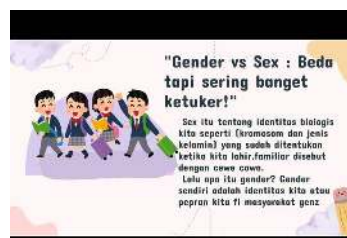
Gambar 3. Contoh Konten Tiktok Sebagai Media BK Klasikal

Konten yang menampilkan kesetaraan gender misalnya, dapat dijadikan model pembelajaran bagi guru BK dalam melaksanakan diskusi kelas, refleksi diri, atau proyek kreatif yang melibatkan peserta didik secara aktif. Dengan demikian, representasi kesetaraan gender dalam konten TikTok menunjukkan bahwa platform ini tidak hanya berfungsi sebagai hiburan, tetapi juga memiliki potensi strategis sebagai media layanan BK. Konselor dapat memanfaatkannya untuk menyampaikan informasi, melakukan intervensi preventif, dan mendukung pengembangan peserta didik secara sosial-emosional. Hal ini sejalan dengan tujuan BK di sekolah, yaitu membantu peserta didik mencapai perkembangan optimal dalam aspek pribadi, sosial, belajar, dan karier, dengan tetap relevan terhadap dinamika budaya digital yang mereka hadapi sehari-hari.