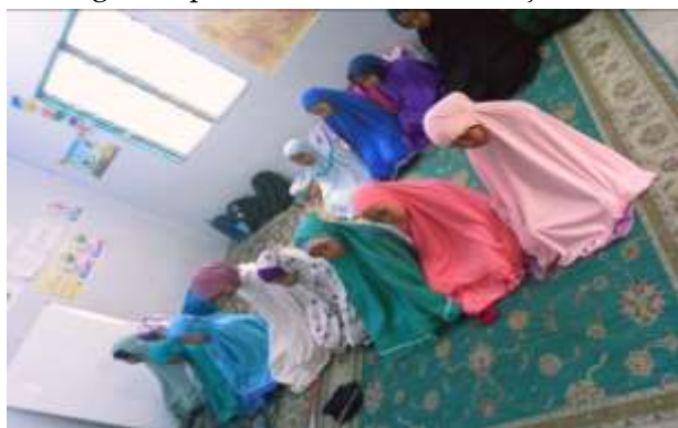
Gambar 3 Kegiatan Shalat Duha (Dokumentasi, 15 Juni 2025)

Pada minggu kedua, 2 anak mulai menghafal gerakan shalat dan menunjukkan minat memimpin. Anak-anak juga mulai memiliki kesadaran untuk bersiap melaksanakan shalat duha sebelum kegiatan belajar dimulai. Hal ini menunjukkan adanya internalisasi nilai ibadah. Di minggu keempat, hampir seluruh anak mampu mengikuti shalat duha tanpa harus diarahkan. Mereka memahami urutan gerakan, mampu membaca niat, dan bahkan mengajari temannya yang belum bisa menghafal tata cara shalat. Berikut salah satu praktik kegiatan spiritual melalui kegiatan praktik shalat Duha berjamaah: