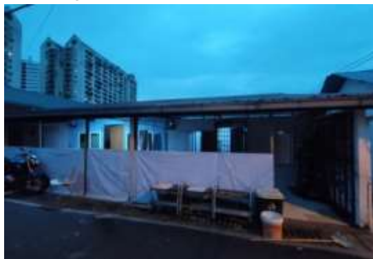
Gambar 4 PKBM PNF Sentul Kuala Lumpur (Dokumentasi, 5 juni 2025)

Gambar dibawah ini merupakan dokumentasi visual yang mendukung aktivitas pendampingan dalam aspek sosial dan keagamaan, khususnya sebagai bagian dari lingkungan belajar anak-anak migran Indonesia di PKBM PNF Sentul, Kuala Lumpur: