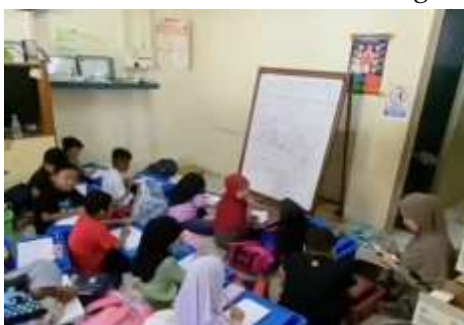
Gambar 2 Kegiatan PKBM Sentul, Kuala Lumpur (Dokumentasi, 23 Juni 2025)

Pendampingan dilaksanakan setiap hari Senin hingga Jumat. Proses belajar dibagi dalam tiga sesi. Sesi pertama pembukaan dan shalat duha berjamaah (15–20 menit), sesi kedua calistung tematik (45 menit), dan refleksi serta ice breaking (15 menit). Metode yang digunakan sangat kontekstual, mulai dari pendekatan fonik, lagu anak, kartu baca, hingga permainan edukatif. Buku bacaan sederhana dari perpustakaan kecil PKBM digunakan sebagai penguat media literasi. Berdasarkan observasi langsung, anak-anak terlihat antusias mengikuti kegiatan dari awal hingga akhir. Saat sesi pembukaan dan shalat duha berjamaah, mereka tampak tertib dan mengikuti arahan guru pendamping dengan baik. Selama pembelajaran calistung, suasana kelas cukup dinamis, namun tetap terkendali, menunjukkan bahwa pendekatan tematik yang digunakan cukup efektif. Anak-anak juga menunjukkan minat tinggi terhadap media pembelajaran seperti kartu baca dan lagu-lagu edukatif yang dinyanyikan bersama. Beberapa anak yang awalnya pasif mulai aktif dan percaya diri mengerjakan latihan. Berikut adalah salah satu gambar kegiatan PKBM sentul: