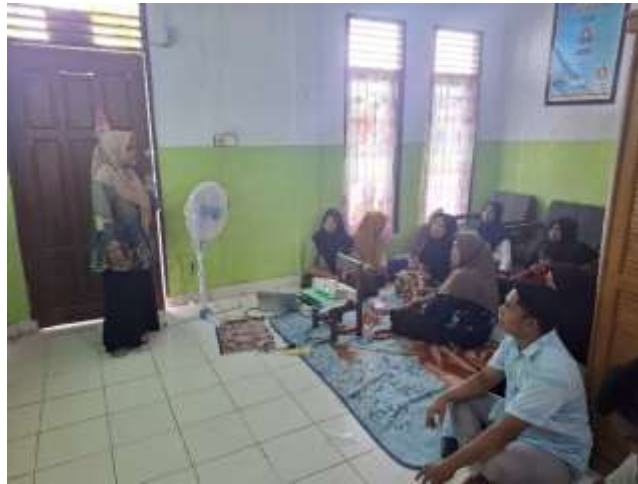
Gambar 2 Penyampaian Materi Investasi Emas

kembali emas yang dimiliki. Harga emas cenderung naik setiap waktu dan keuntungan itu didapat dari selisih antara harga beli dengan harga jual. Namun dengan perkembangan teknologi saat ini, investasi emas dapat dilakukan dengan menggunakan smartphone . Sudah banyak tersedia platform digital yang menyediakan pembelian emas sehingga memudahkan masyarakat untuk berinvestasi.