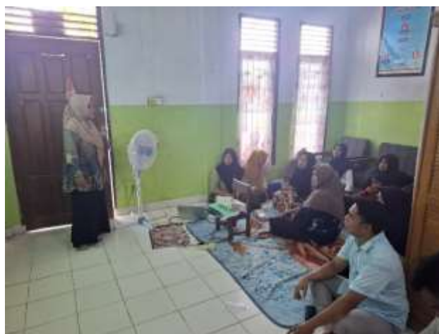
Gambar 3 Diskusi dan Tanya Jawab

Pada sesi ini tim pengabdian Masyarakat Rokania memberikan kesempatan seluas-luasnya kepada peserta untuk bertanya dan berdiskusi terkait materi investasi emas yang telah disampaikan. Dari hasil diskusi peserta sangat antusias bertanya mengenai Investasi emas khususnya cara pendaftar dan persyaratan memiliki investasi emas di platform digital serta keuntungan dan kerugian yang perlu diantisipasi agar investasi emas kita menguntungkan dimasa depan.