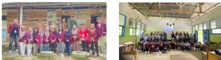
Gambar 3. Dokumentasi Edukasi Anti Bullying

Selanjutnya edukasi Anti Bullying yang bertujuan untuk memperkuat pola interaksi sosial yang lebih sehat, minim konflik, dan bebas dari kekerasan. Secara kelembagaan, sekolah diharapkan dapat menerapkan prinsip-prinsip anti-bullying sebagai bagian dari budaya sosial serta mendukung gerakan cinta rupiah secara berkelanjutan. Selain itu, Pelajar juga mulai memahami bentuk-bentuk perundungan, dampaknya, dan langkah-langkah penanganan bullying jika terjadi di lingkungan mereka.