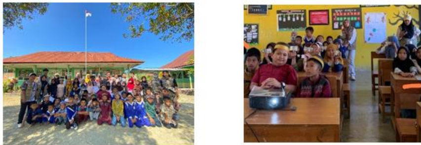
Gambar 2. Dokumentasi edukasi CBPR (Cinta Bangga Paham Rupiah)

Pelaksanaan kegiatan ini diharapkan membawa dampak positif baik dalam jangka pendek maupun jangka panjang. Dalam jangka pendek, pelajar menunjukkan peningkatan pemahaman mengenai ciri keaslian rupiah, cara menjaga uang agar tetap layak edar, serta pentingnya menggunakan rupiah dalam transaksi sehari-hari sebagai bentuk cinta tanah air. Dalam jangka panjang, kegiatan ini diharapkan dapat menanamkan kebiasaan pelajar dalam menggunakan rupiah secara bijak, dan meningkatkan rasa bangga terhadap identitas bangsa.