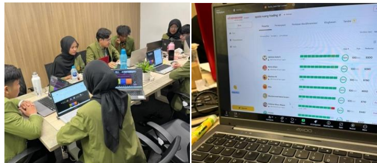
Gambar 2. Kuis Interaktif

Tingkat keterlibatan dan antusiasme yang tinggi dalam acara ini, yang ditunjukkan melalui partisipasi peserta, sesi tanya jawab yang berlangsung lebih lama dari yang direncanakan, kuis interaktif, dan distribusi produk, menunjukkan bahwa konten disajikan dengan cara yang mudah dipahami dan jelas. Webinar ini telah berfungsi secara efektif sebagai alat bantu pembelajaran digital untuk meningkatkan pemahaman peserta tentang perdagangan dan manajemen risiko dengan mengoptimalkan penerapan pengetahuan melalui teknik visual, studi kasus, demonstrasi langsung, dan keterlibatan yang intensif. Berikut gambar penggunaan kuis interaktif sebagai sarana meningkatkan partisipasi peserta sekaligus melakukan evaluasi peserta melalui observasi partisipatif.