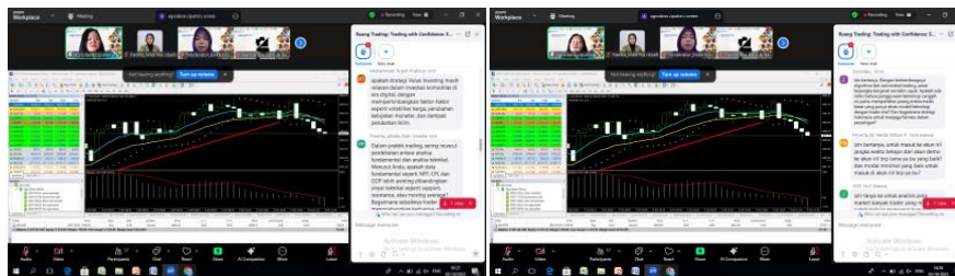
Gambar 3. Demonstrasi dan Diskusi

Interaksi media sosial dan insentif merupakan contoh proses tindak lanjut dan insentif yang menjamin kelangsungan pembelajaran risiko. Secara keseluruhan, webinar telah terbukti berhasil dalam mengubah perilaku dan memotivasi peserta untuk mengadopsi teknik manajemen risiko yang lebih baik ketika informasi instruksional dipadukan dengan contoh nyata dan insentif. Berikut gambar demonstrasi langsung dan diskusi interaktif untuk mengaitkan materi perdagangan berjangka dengan praktik pasar nyata.