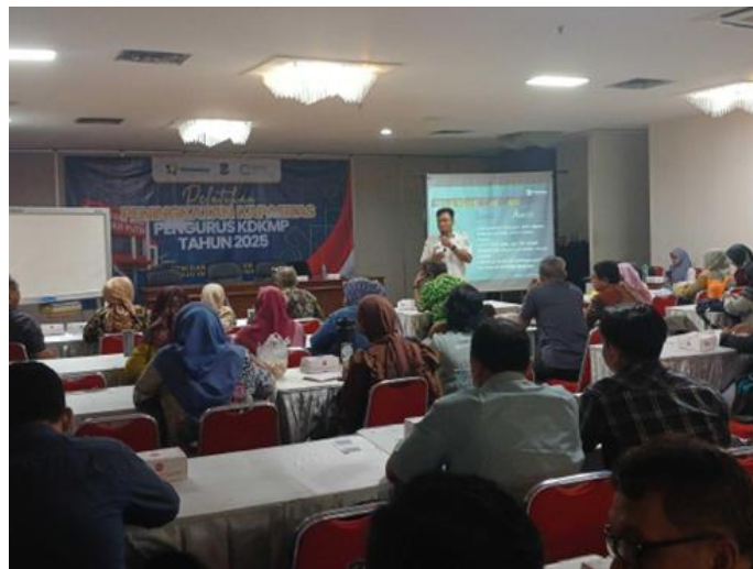
Gambar 1. Penyampaian Materi Oleh Narasumber

Kegiatan pelatihan peningkatan kompetensi pengurus Koperasi Kelurahan Merah Putih, khususnya wakil ketua bidang anggota, dilaksanakan secara bertahap dari tanggal 3 hingga 12 November 2025 di Convention Hall Siola Lt. 4 Surabaya. Peserta pelatihan terdiri dari wakil ketua bidang anggota dari 153 Koperasi Kelurahan Merah Putih yang tersebar di seluruh kelurahan Kota Surabaya. Data primer yang dikumpulkan melalui metode pretest dan post test menunjukkan adanya peningkatan signifikan dalam pemahaman dan kapasitas wakil ketua bidang anggota setelah mengikuti bimbingan teknis.