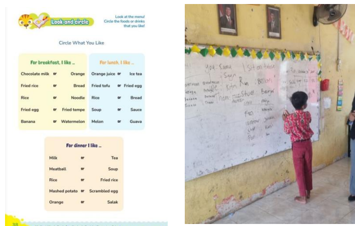
Gambar 1 Materi Belajar Bahasa Inggris kelas II

Kegiatan pembelajaran Bahasa Inggris dilaksanakan di kelas III dengan materi "Say the Hobby" yang disesuaikan dengan buku pelajaran yang digunakan oleh siswa. Pembelajaran ini dirancang dengan menerapkan pendekatan fun learning , yaitu pembelajaran yang menekankan suasana menyenangkan agar siswa lebih aktif, antusias, dan mudah memahami materi yang diajarkan.