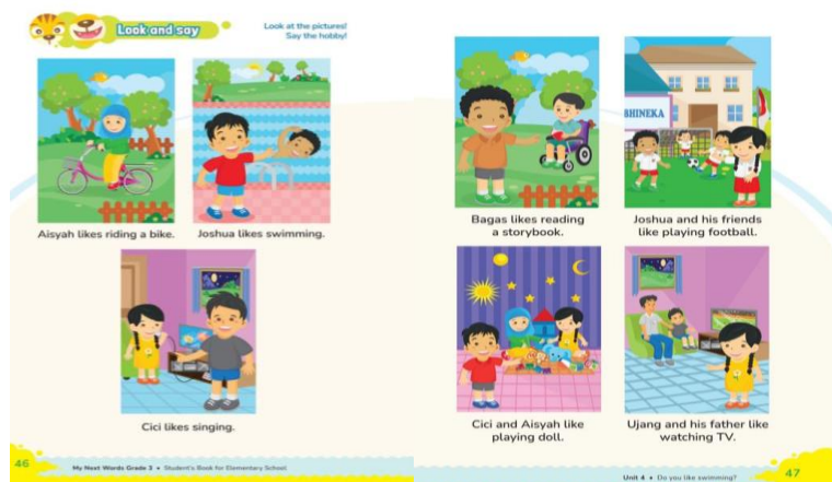
Gambar 2 materi say the hobby kelas III

Melalui kegiatan ini, siswa tidak hanya belajar mengenal dan menghafal kosa kata hobi dalam Bahasa Inggris, tetapi juga dilatih untuk berani tampil di depan kelas. Banyak siswa yang awalnya terlihat malu atau ragu, namun setelah melihat teman-temannya tampil, mereka menjadi lebih percaya diri dan berani mencoba. Hal ini menunjukkan bahwa kegiatan Charades dapat membantu rasa percaya diri siswa secara bertahap dalam suasana yang aman dan menyenangkan. Selain itu, permainan Charades juga mampu membuat konsentrasi dan motivasi belajar siswa. Siswa harus fokus memperhatikan gerakan temannya agar dapat menebak dengan tepat, sehingga perhatian mereka terhadap pembelajaran tetap terjaga. Adanya sistem poin juga membuat siswa semakin termotivasi untuk aktif berpartisipasi dan menggunakan Bahasa Inggris dengan benar.