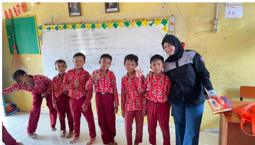
Gambar 5 pembagian hadiah kepada siswa dengan poin paling banyak

Pelaksanaan Fun Learning Activity pada mata pelajaran Bahasa Inggris di kelas III SDN 6 Tanjung Lago selama bulan Oktober–November 2025 menghasilkan temuan yang menunjukkan keterlibatan siswa yang meningkat, partisipasi aktif dalam setiap aktivitas pembelajaran, serta munculnya keberanian siswa untuk menggunakan Bahasa Inggris dalam konteks nyata. Pada tanggal 30 Oktober 2025, kegiatan difokuskan pada pengenalan kosakata Bahasa Inggris terkait makanan dan minuman yang sering dijumpai dalam kehidupan sehari-hari siswa. Aktivitas menulis kosakata secara bergantian di papan tulis dan soal acak yang memadukan Bahasa Inggris dan Bahasa Indonesia berhasil membuat siswa tidak hanya menerima materi secara pasif, tetapi mengalami langsung proses pembelajaran yang interaktif. Dengan pemberian poin untuk jawaban yang benar, suasana kelas menjadi lebih kompetitif dalam arti yang positif, mendorong siswa lebih antusias untuk aktif menjawab dan mengambil bagian. Sebagian besar siswa mampu menuliskan kosakata dengan benar serta mengucapkannya, bahkan mereka yang awalnya malu tampil menjadi lebih nyaman tampil di depan kelas.