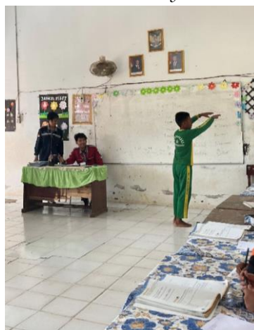
Gambar 3 siswa memperagakan hobinya