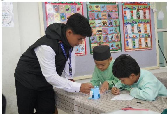
Gambar 1. Penulisan kosakata bahasa arab

Oleh Karena itu, pembelajaran kosakata bahasa Arab sebaiknya dilakukan secara bertahap dan terus-menerus. Beberapa cara yang dapat diterapkan yaitu menghafal kosakata dasar, mengelompokkan kata sesuai tema, menuliskan kembali kosakata yang telah dipelajari, serta mempraktikkannya dalam kalimat sederhana. Melalui latihan yang dilakukan secara rutin dan diulang-ulang (metode drill), kosakata tidak hanya sekedar diingat, tetapi juga dapat dipahami dan digunakan dengan baik.(Team 2025)