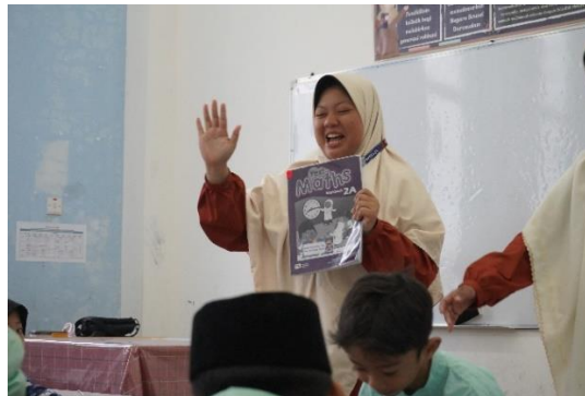
Gambar 2. Penyampaian kosakata Bahasa Arab dengan media gambar