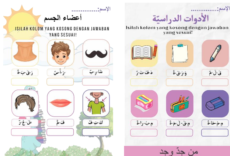
Gambar 4. Tugas Latihan menulis kosakata dalam Bahasa Arab.

Dalam tahapan selanjutnya, para peserta diminta untuk mengerjakan tugas dengan rangkaian huruf hijaiyah yang belum tersambungkan untuk menjadi satu kata yang sesuai dengan gambar yang disediakan. Hal ini bertujuan untuk mempermudah siswa dan siswi sekolah rendah untuk mengingat kosakata tersebut melalui tulisan. Dalam tahapan ini tim KKN menggunakan metode drill dengan spesifikasi sebagai individual drill dimana para siswa dan siswi mengerjakan latihan tersebut secara personal. Adapun bentuk tugas dalam pelaksanaan latihan menulis Adalah sebagai berikut: