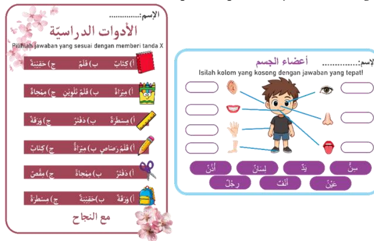
Gambar 5. Tugas Materi Anggota Badan dan Peralatan Sekolah.

Pada tahapan berikutnya para peserta dapat menyelesaikan tugas yang sesuai dengan materi yang disampaikan selama proses pembelajaran. Pemberian tugas dalam tahapan ini dilengkapi dengan berbagai permainan dan penyampaian yang menarik guna meningkatkan daya ingat para peserta didik. Para peserta didik diminta untuk menuntaskan tugas tersebut dengan cara diskusi bersama kelompok. Hal ini bertujuan untuk menilai keaktifan siswa dan siswi selama proses pembelajaran berlangsung.