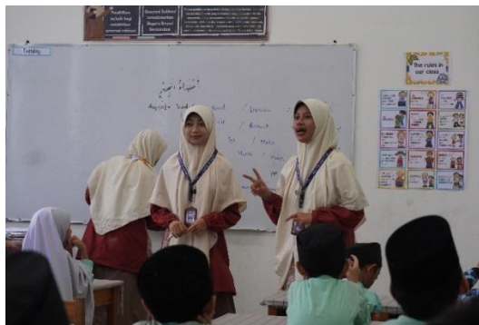
Gambar 3. Pengajaran kosakata Bahasa arab dengan metode drill lisan

kemampuan ekspresi lisan dan tulis, terutama dalam pembelajaran kosakata dan keterampilan berbicara Bahasa Arab. (Mardhatillah Syahril, Puput Nurshafnita, and Fauziah Nasution, 2023).