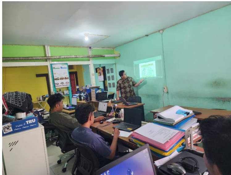
Gambar 3. Pelaksanaan focus group discussion (FGD) validasi instrumen checklist inspeksi struktural lapangan bersama peserta pelatihan

Analisis kompetensi dilakukan menggunakan normalized gain (N-gain) dengan formula g = (S_{post} - S_{pre}) / (S_{maks} - S_{pre}) sebagaimana dikembangkan oleh Hake (1998), dengan kategori: g \geq 0,70 tinggi, 0,30 \leq g < 0,70 sedang, dan g < 0,30 rendah. Hasil perbandingan skor pre-test dan post-test seluruh peserta disajikan pada Tabel 2.