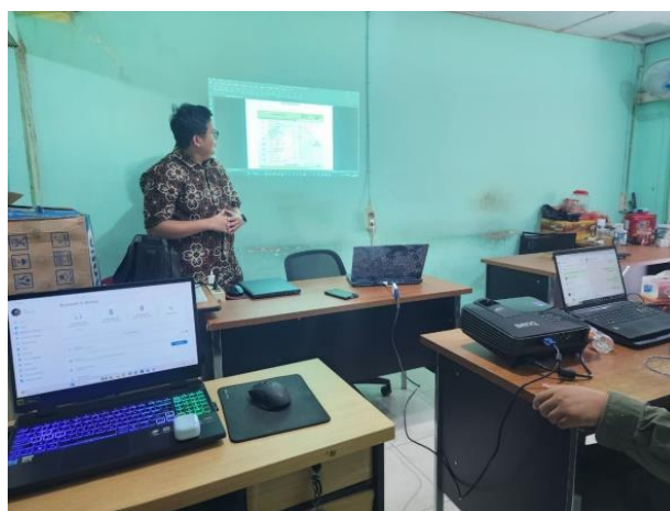
Gambar 2. Pemaparan Materi Identifikasi Kerusakan Struktural Dini pada Bangunan Gedung di Lahan Gambut

Kegiatan pelatihan identifikasi kerusakan struktural dini dilaksanakan di CV. Bhipraya Cipta, Kota Pontianak, dengan diikuti oleh 7 orang peserta yang seluruhnya hadir dan menyelesaikan seluruh rangkaian kegiatan dari pre-test hingga post-test. Sesi pagi berlangsung interaktif dengan antusiasme yang tinggi, khususnya pada segmen pembahasan korelasi antara mekanisme penurunan diferensial fondasi gambut dan distribusi pola retak pada elemen struktural, yang oleh sebagian besar peserta diakui sebagai perspektif baru yang belum pernah mereka peroleh secara terstruktur sebelumnya. Sesi siang yang difokuskan pada praktikum pengisian checklist inspeksi berbasis foto kasus nyata berjalan produktif, dengan peserta menunjukkan kemampuan analitis yang berkembang secara bertahap dalam mengklasifikasikan tingkat keparahan kerusakan. Forum FGD yang menindaklanjuti praktikum menghasilkan diskusi substantif dan teridentifikasi sejumlah gap prosedural yang kemudian disepakati sebagai dasar penyempurnaan instrumen checklist.