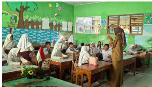
Gambar. 2 Pelaksanaan P5 pertemuan ke-1

Negeri Lialang telah berhasil menumbuhkan kemandirian, rasa tanggung jawab, dan kreativitas peserta didik. Melalui kegiatan proyek seperti pembuatan peta timbul dan kerajinan stik es krim, peserta didik belajar memecahkan masalah, mengambil keputusan, dan menunjukkan tanggung jawab terhadap hasil kerja mereka sesuai dengan nilai utama Profil Pelajar Pancasila: mandiri, kreatif, dan gotong royong. Dengan demikian, pelaksanaan P5 di SD Negeri Lialang tidak hanya fokus pada akademik, tetapi juga berhasil membentuk karakter peserta didik agar mandiri, bertanggung jawab, dan percaya diri dalam menghadapi berbagai tantangan belajar.