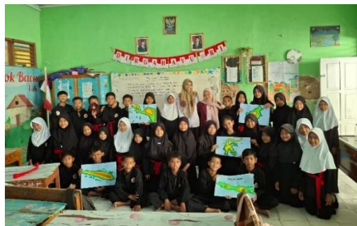
Gambar. 3 Pelaksanaan P5 pertemuan ke-2