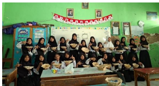
Gambar. 4 Pelaksanaan P5 pertemuan ke-3